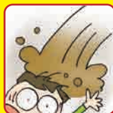
土砂災害警戒情報