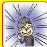
けいたくん防犯情報