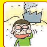
光化学スモッグ 注意報